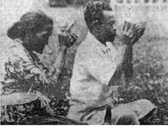
Een Balinese man en vrouw bidden en brengen een offer te midden van de vernietiging, die de hete lava van de vulkaan Goenoeng Agoeng rond de tempel van Besakih heeft

naar Indonesië heeft verzonden, zal worden gevolgd door een tweede zending, bestaande uit 5300 kilo goederen ter waarde van 70 duizend gallon.