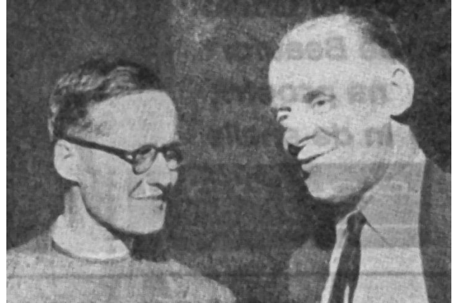
Bisschop Newbegin (links) en dr. Visser 't Hooft, die respectievelijk als secretaris van de commissie voor wereldzending en evangelisatie van de Wereldraad van Kerken en als algemeen secretaris van de wereldraad in Bangkok waren.