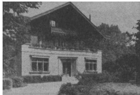
Een van de chalets waarin de Wereldraad tot dusver een onderdak vond. Tot nu toe woonden in het Oecumenisch Hoofdkwartier in houten, meer „voorlopige" gebouwen. Laat men ook in Genève niet vergeten dat de kerk nooit „arrivé" kan zijn, maar altijd op weg is ...

Wel beluisteren we ook kritische stemmen. Ze willen de feestvreugde bij de opening van het nieuwe complex in Genève niet bederven maar waarschuwen wel: Het kan gevaarlijk worden, al die mooie betonnen gebouwen.